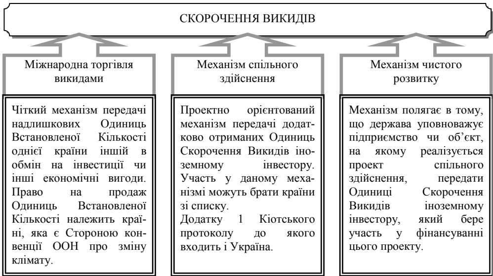
Рис. 1. Ринкові механізми виконання кількісних зобов'язань щодо скорочення викидів