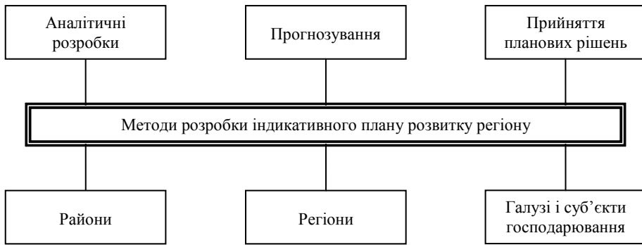
Рис. 2. Схема взаємозв'язку об'єктів, завдань і методів індикативного планування розвитку регіону

Сукупність методів і моделей реалізується в рамках технологічної схеми розробки індикативного плану соціально-економічного розвитку регіону (рис. 3).