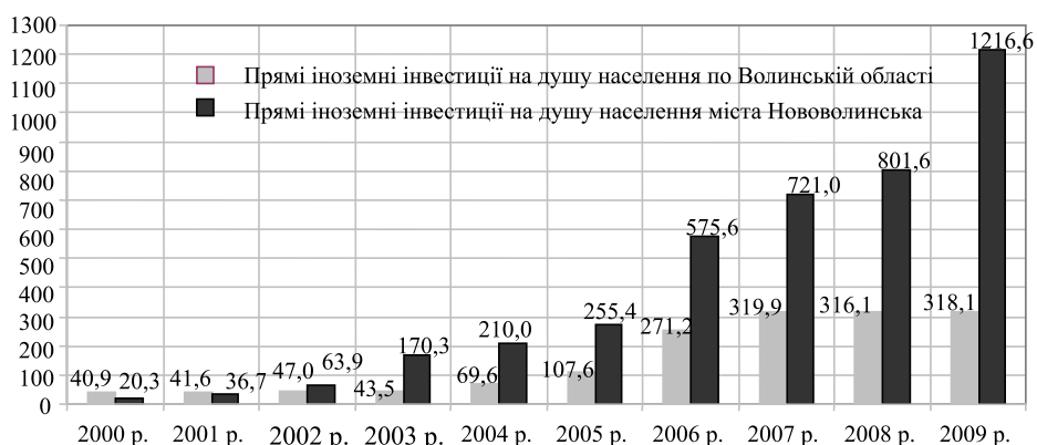
Рис. 2. Динаміка прямих іноземних інвестицій на одиницю населення по регіон упродовж 2000-2009 рр. (дол. США) [7]