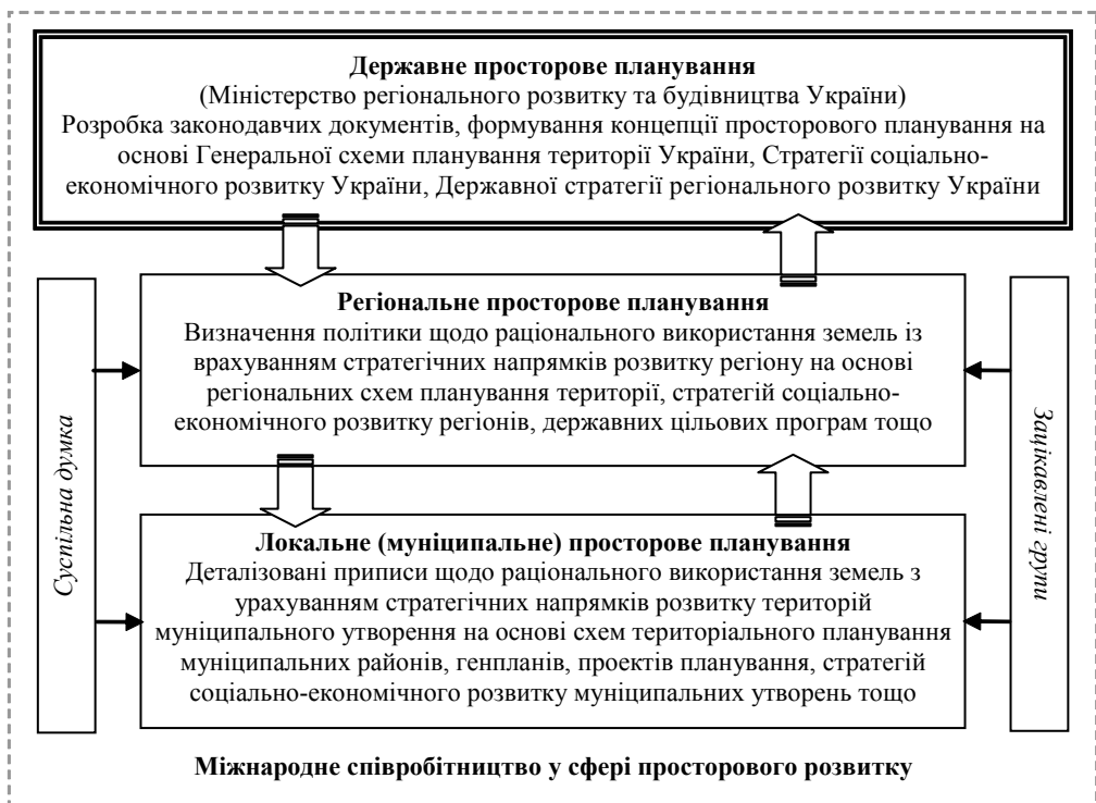
Рис. 3. Система просторового планування в Україні

Базуючись на досвіді європейських країн та наявній системі і діючих механізмах територіального планування в Україні, система просторового планування може включати в себе три рівні (рис. 3):