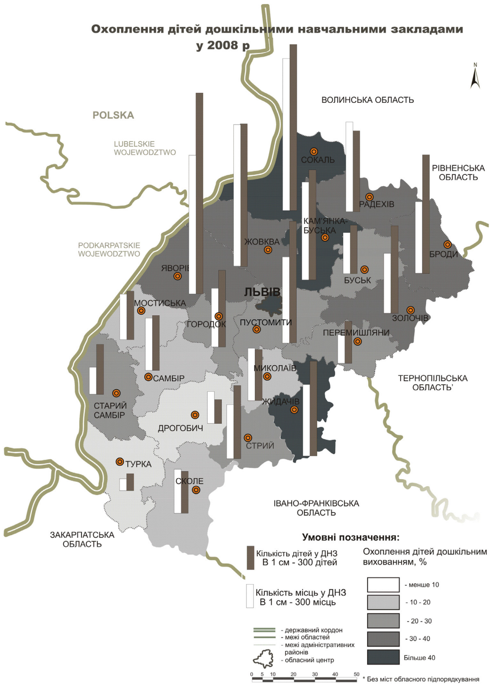
Рис. 3. Охоплення дітей дошкільними навчальними закладами (Авторська розробка за: [6])