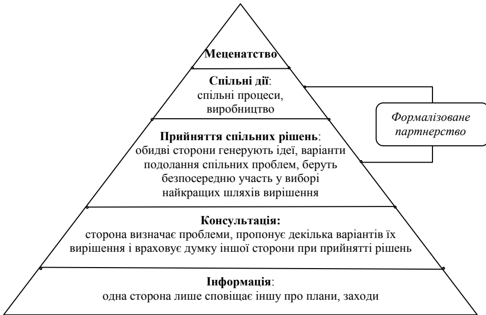
Рис. 1. Рівні співпраці (опрацювання авторів)

раці, наявність спільних для партнерів проблем та пошук оптимальних шляхів здійснення спільних дій для їх вирішення чи попередження на основі законності, добровільності, самообмеження, рівноправності, взаємоповазі і взаємних поступках сторін у процесі переговорів (рис. 1).