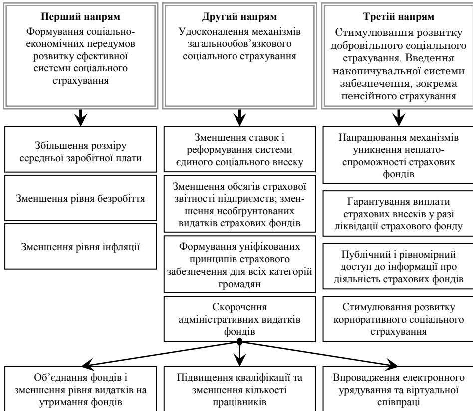
Рис. 2. Цільова структура напрямів розвитку системи соціального страхування в Україні