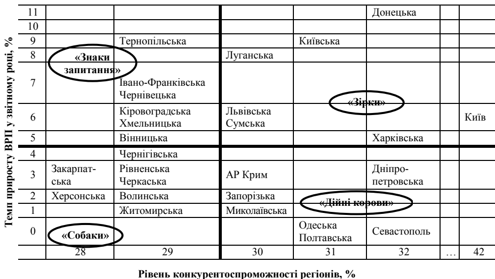
Рис. 2. Матриця БКГ для визначення стратегічних груп регіонів України за рівнем конкурентоспроможності

Матриця БКГ (рис. 2) вказує на те, що для регіонів типу «Собаки» доцільною є трансформаційна стратегія, типу «Знаки запитання» – наступальна стратегія,