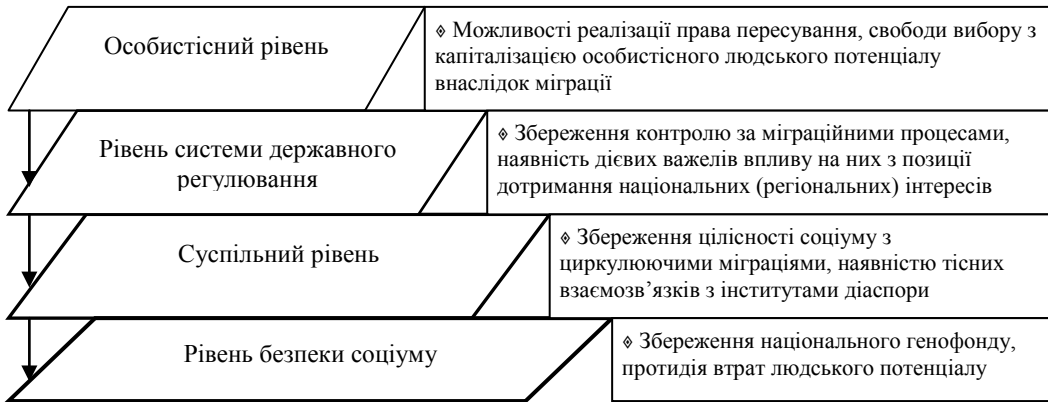
Рис. 2. Рівні оцінювання ефективності механізму регулювання міграції населення Складено автором.

механізму потребує постійного вдосконалення – з огляду на новітні виклики і тренди. Обґрунтувати пріоритети вдосконалення дозволять результати оцінювання його ефективності, що можна здійснювати через різні підходи. Найбільш практично цінним є підхід визначення ефективності за результатом. Він вимагає визначення системи показників оцінювання та здійснення конкретних розрахунків, що буде предметом подальших досліджень автора.