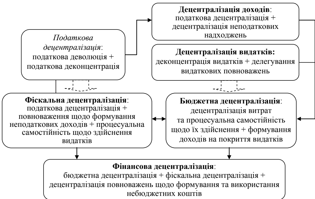
Рис. 1. Декомпозиція поняття «фінансова децентралізація»

При цьому зауважимо, що сьогодні у вітчизняній економічній науці паралельно вживаються поняття «фінансова децентралізація», «фіскальна децентралізація», «бюджетна децентралізація», що мають досить синонімічний характер. Водночас фінансова децентралізація є ширшим поняттям, яке охоплює усю систему фінансової взаємодії між державою та органами місцевого самоврядування (рис. 1).