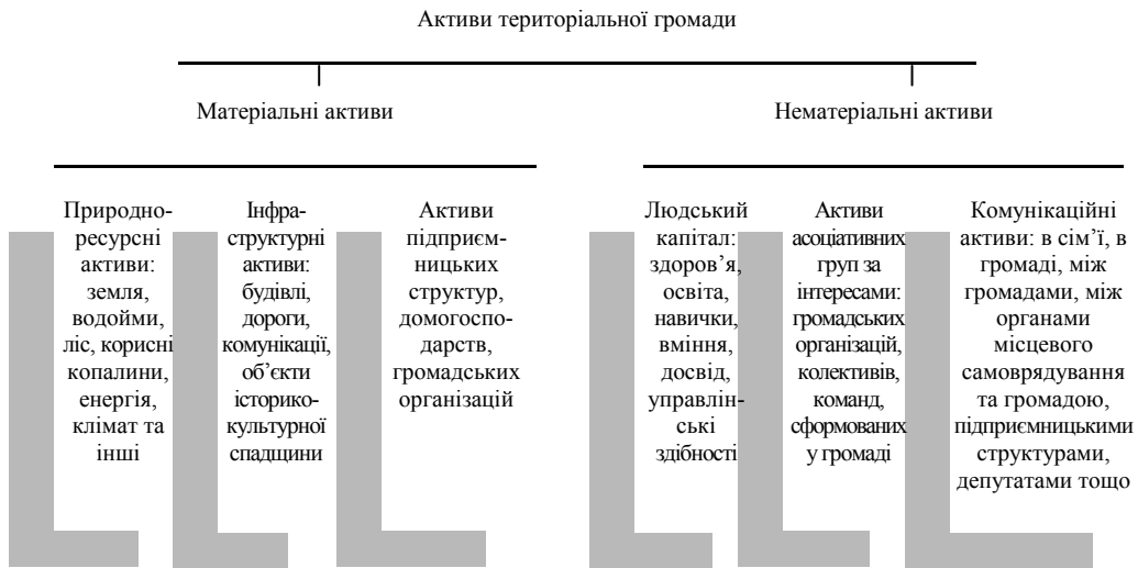
Рис. 1. Структура активів територіальної громади

З огляду на особливості розвитку територіальних громад як соціально-економічної системи та соціальної спільноти водночас, вважаємо за доцільне в класифікації активів територіальних громад виділяти матеріальні і нематеріальні активи. Зауважимо, що один і той же актив може поєднувати як матеріальну, так і нематеріальну складову. Для прикладу: школа територіальної громади як будівля є активом соціальної інфраструктури, а шкільний колектив – нематеріальним активом асоціативного типу (рис. 1).