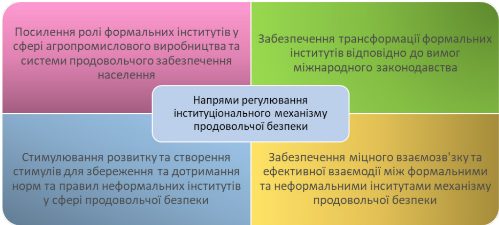
Рис. 2. Напрями регулювання інституціонального механізму продовольчої безпеки

міцного взаємозв'язку та ефективної взаємодії між формальними та неформальними інститутами механізму продовольчої безпеки (рис. 2).