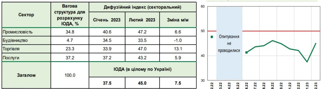
Рис. 1. Індекс очікувань ділової активності підприємств (ЮДА), лютий 2023 р.