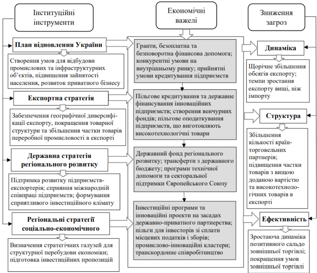
Рис. 2. Механізм зниження загроз зовнішньоторговельній безпеці регіонів України в період повоєнної відбудови економіки