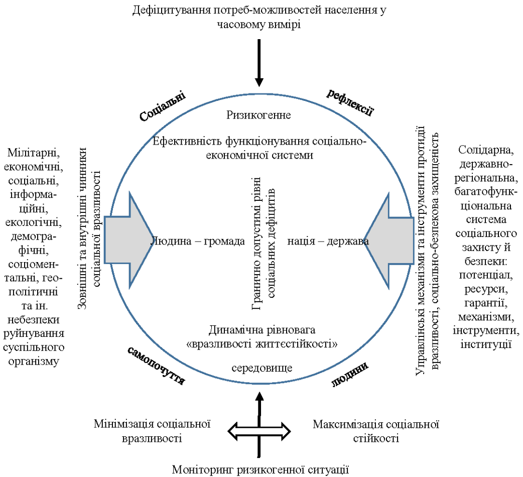
Рис. 2. Функціональна модель соціально-економічної безпекової резилентності (особиста захищеність – геополітична безпека)