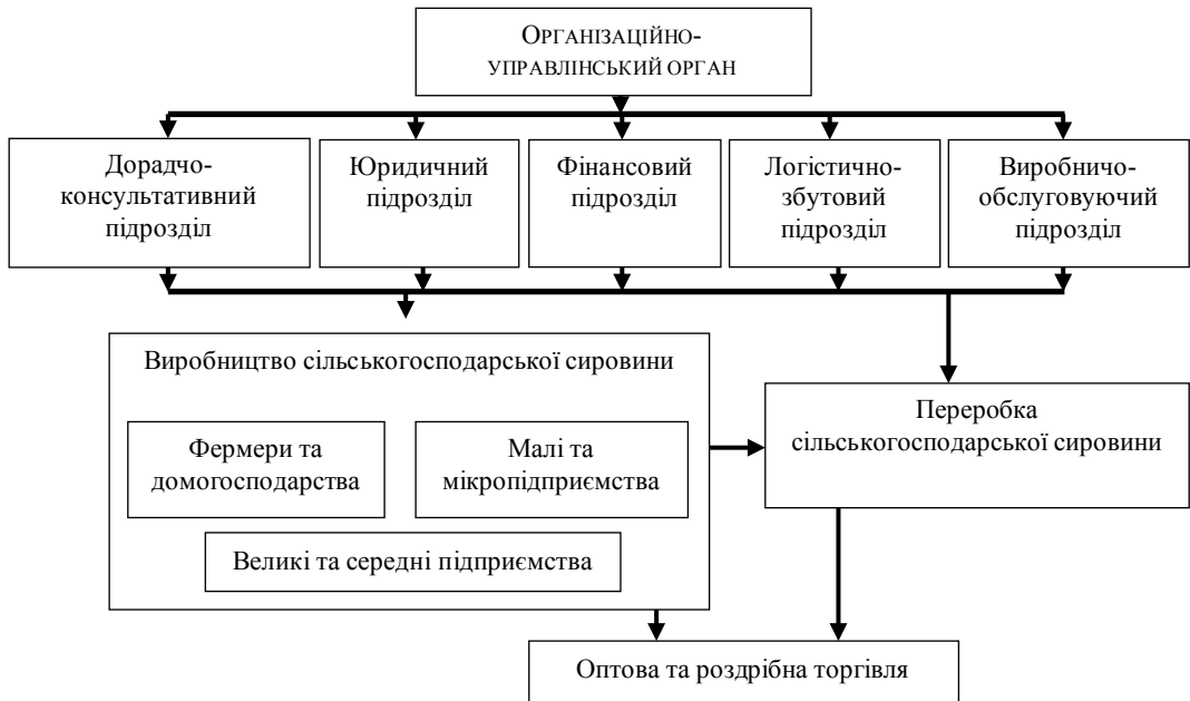
Рис. 1. Загальна схема структури агропромислового кооперативу