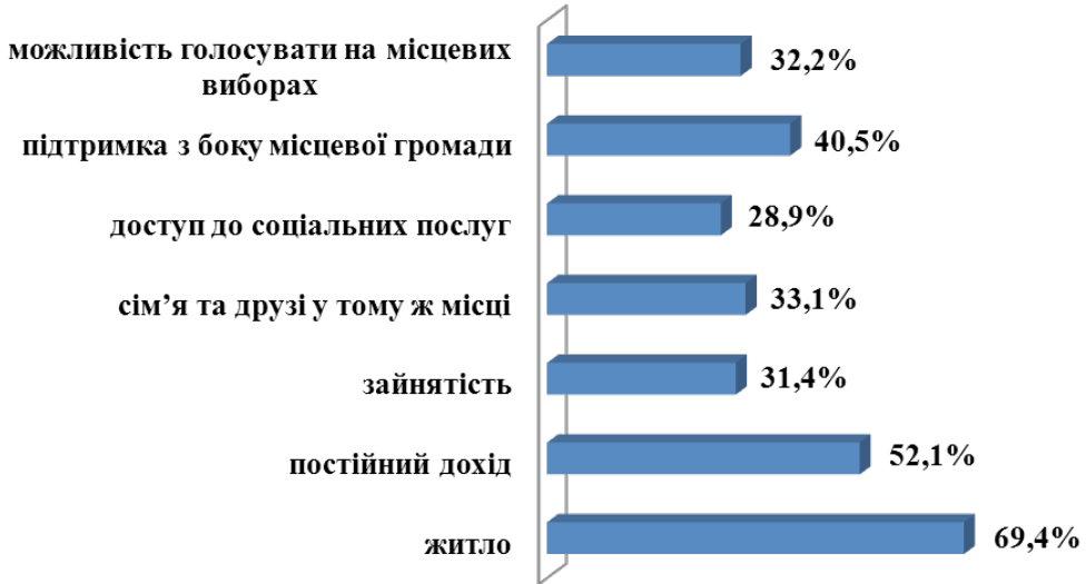
Рис. 2. Умови інтеграції ВПО до приймаючої громади (відсоток респондентів)

На рис. 2 зазначено аспекти, які викладачі-переселенці переміщеного університету вважають важливими умовами інтеграції до місцевої громади. Респонденти оцінювали такі фактори інтеграції: житло, постійний дохід, зайнятість, родина та друзі в тому ж місці, доступ до соціальних послуг, підтримка з боку місцевої громади та можливість голосувати на місцевих виборах.