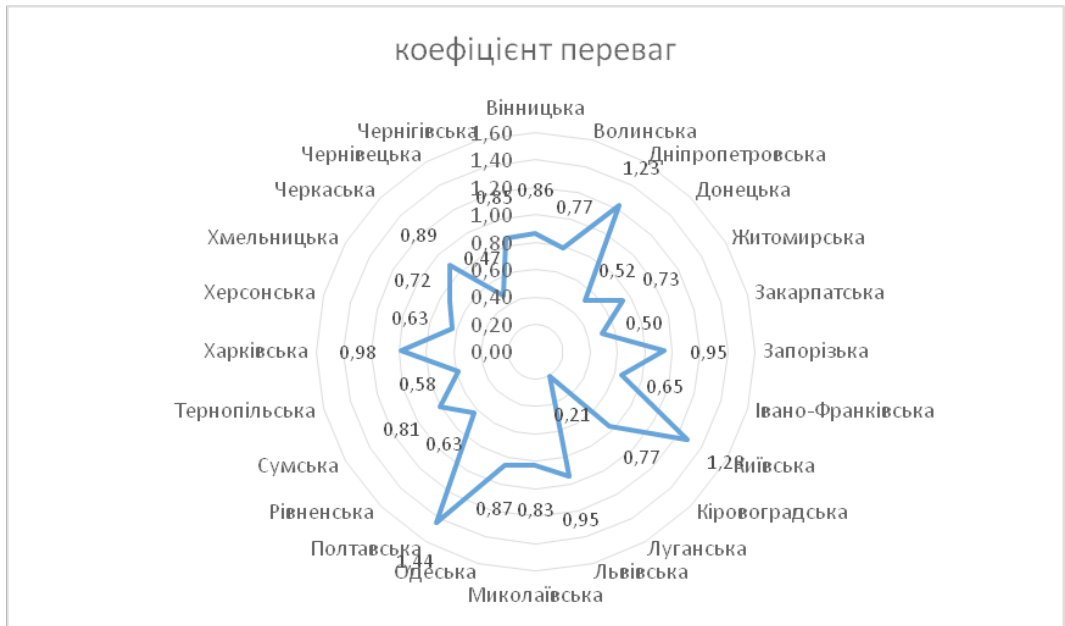
Рис. 2. Регіональні особливості коефіцієнта переваг у 2020 р.

Регіони з перевагами фінансово-економічного потенціалу характеризуються вищою часткою ВРП на одну особу (коефіцієнт переваг) [9] (рис. 2). Найвний економічний потенціал територій є першорядним чинником наповнення доходів місцевих бюджетів. Основна частка доходів місцевих бюджетів належить до еластичних джерел надходжень, тобто тих, що суттєво залежать від змін макропоказників, ВРП та економічної ситуації в регіоні чи країні (ПДФО, єдиний податок, акцизний податок та інші).