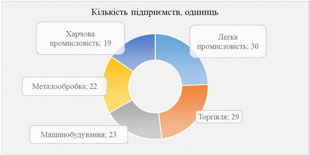
Рис. 2. Кількість підприємств, які переїхали у Львівську область з початку повномасштабних воєнних дій, на липень 2022 р.

Джерело: побудовано автором на основі даних [10].